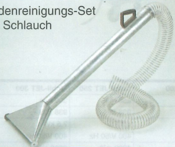
Bodenreinigungs-Set mit Schlauch