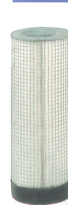
für mobil 100 Art.Nr. 195 193